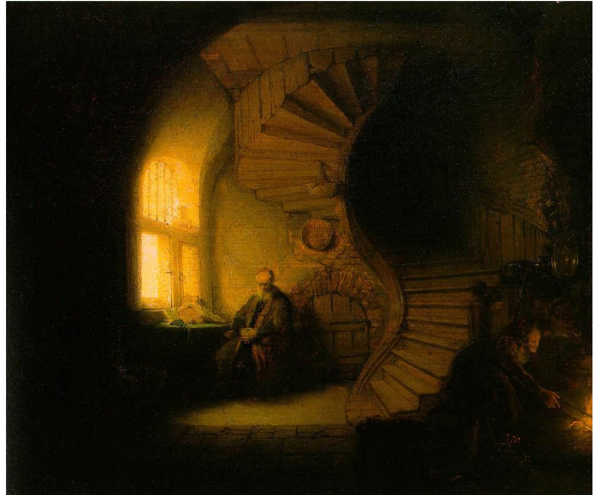
Mediterende filosoof. Rembrandt, 1632.